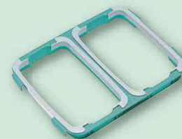
Mülltrennung benötigt? Einfach anstecken