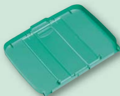
Deckel mit Reinigungsplan