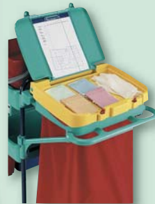
Extra Platzbedarf? Deckel mit Doppel- stauraum