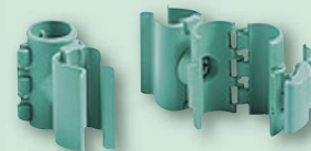
Schraubloser Stielhalter schnell und einfach zu verstellen