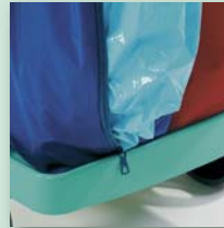
Polysäcke 120 l oder 70 l mit Reißverschluss