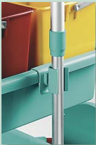
Stielhalter für Schalen