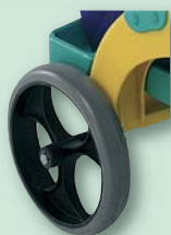
200 mm Axialräder